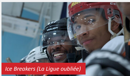
Ice Breakers (La Ligue oubliée)

pour les descriptions des films et les avertissements sur le contenu.